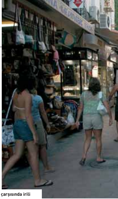
Cıvıl cıvıl Bodrum çarşısında irili ufaklı çok sayıda dükkan bulunuyor.